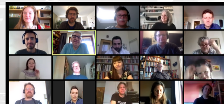
Online SMS Network Meeting, March 2020

Le groupe de travail s'est concentré sur les données d'un questionnaire sur les projets de numérisation et dématérialisation en cours , pour décider de la stratégie de suivi et de diffusion. Des entrevues de suivi permettront de collecter des informations plus approfondies sur les projets retenus. Parallèlement, le groupe a rédigé un article exposant un ensemble de principes pédagogiques pour guider l'avenir de l'enseignement en ligne et mixte. Cet article a été soumis à la revue internationale Technology, Pedagogy and Education , évaluée par des pairs.